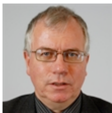
Professor, Cand. Oecon.